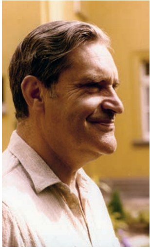
70/80er Jahre vor dem Gartenhaus