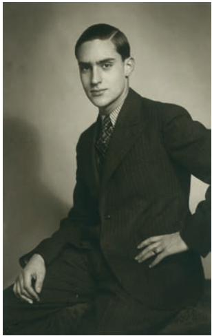
Als Abiturient 1938

wartete der „Reichsarbeitsdienst“ und die Einberufung zum Militärdienst auf die jungen Männer. Unser Vater überstand den bald danach ausgebrochenen 2. Weltkrieg zumindest äußerlich ohne Verwundungen, aber es wurde in späteren Jahren offensichtlich, dass er sich von den Eindrücken und Erlebnissen jener Zeit niemals mehr ganz befreien konnte. Nach seiner Gefangennahme durch die amerikanische Armee im April 1945 wurde er erst am 13.7.1946 aus dem Gefangenenlager in Andernach-Remagen entlassen.