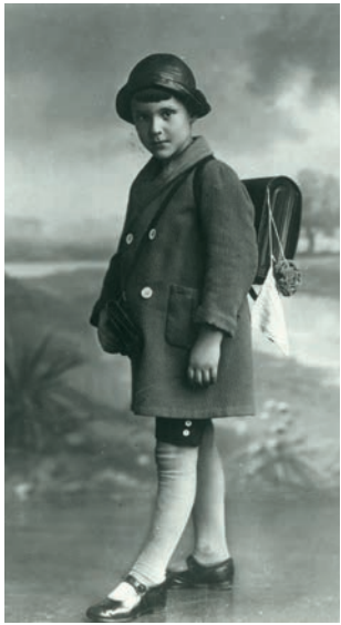
Auf dem Weg zur Oberkasseler Volksschule