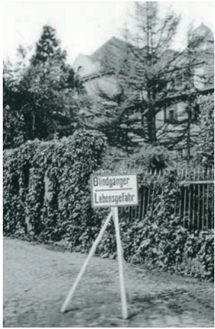
Unmittelbare Nachkriegszeit 1945/46