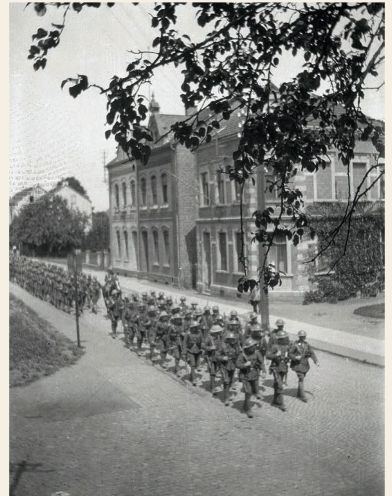
1919: 1. Weltkrieg, britisch-kanadische Soldaten besetzen die Schule.

Eine sorgenfreie Zeit nach ihrer Reifeprüfung erlebte die Abiturientia von 1938 aber nicht, denn nach dem Examen