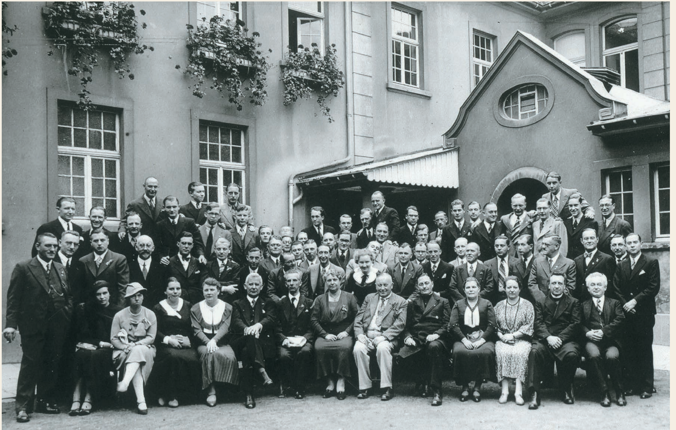
Abiturientenjahrgang 1938 mit Lehrern und Verwaltung vor dem „Badehaus“ (heute Lehrerzimmer)