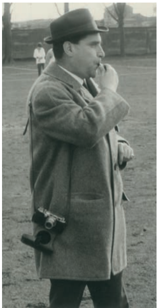
K.F. Anfang der 50er Jahre auf dem Sportplatz

Internat maßgeblich zu helfen. Überfüllung der Hörsäle und nicht selten Willkür und Schikane bestimmten den universitären Lehrbetrieb. Nur eine Bootsfahrt vom rechtsrheinischen zum linksrheinischen Ufer ermöglichte am Morgen den Besuch entsprechender akademischer Veranstaltungen an der Universität. So war er froh, nach seinem 1. Staatsexamen 1953 und der anschließenden Referendarzeit am Hansa Gymnasium in Köln und dem Siebengebirgsgymnasium in Bad Honnef 1955 als Lehrer von seinem Vater im Jahr des 75. Schuljubiläums angestellt zu werden. Er fühlte sich dem „Werk seines Großvaters“ ganz persönlich verpflichtet, eine Grundhaltung, die ihn bis zu seinem Tod ausgezeichnet hat.