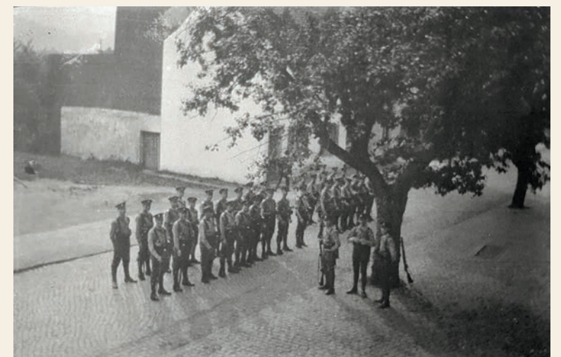
Antreten vor dem Buschhaus, Königswinterer Straße