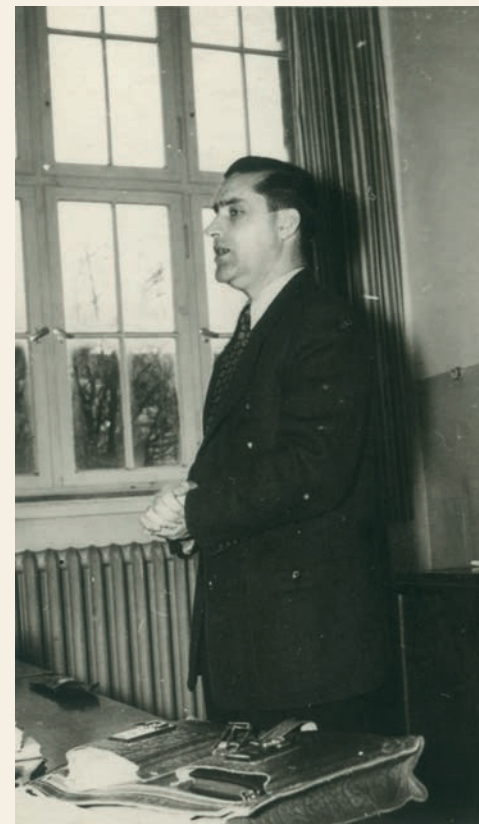
Anfang der 50er Jahre