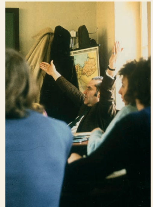
Im Raum 20 während der 70er Jahre: „lehrerzentrierter Unterricht“