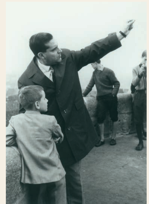
Klassenfahrt in den 50er Jahren