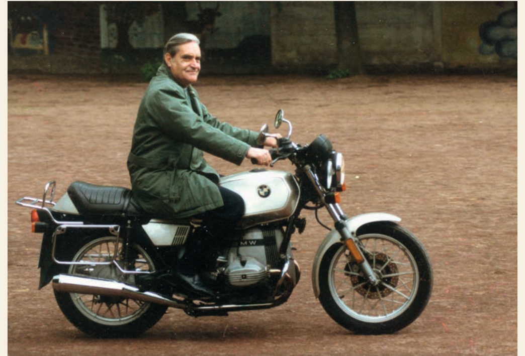
Ehrenrunde auf dem Sportplatz auf einem Schulfest in den 80er Jahren