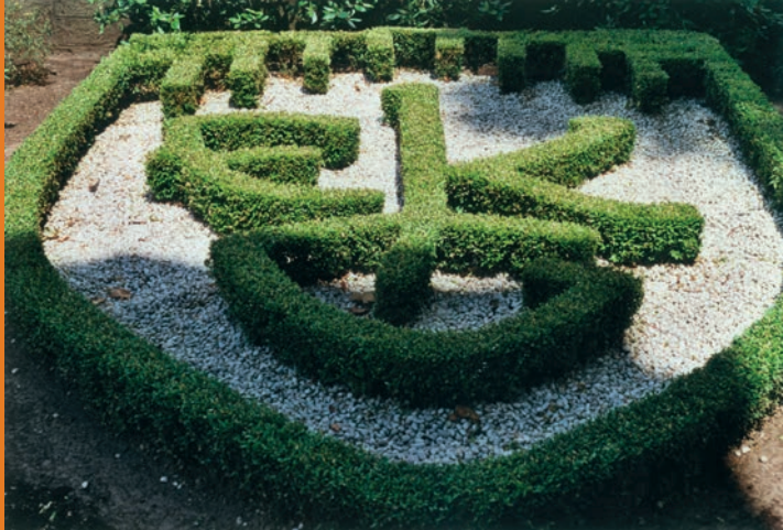
Geburtstagsgeschenk des Lehrerkollegiums