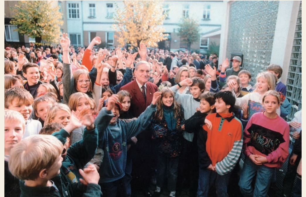
80. Geburtstag – Begeisterung auf dem Schulhof